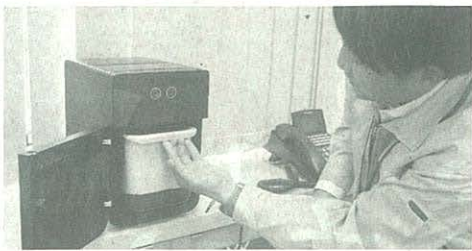
シマが開発した新型の生ごみ乾燥機。パリパリの状態にできる(写真上)。生ごみを入れるバスケットの形状を工夫し、効率化に成功した